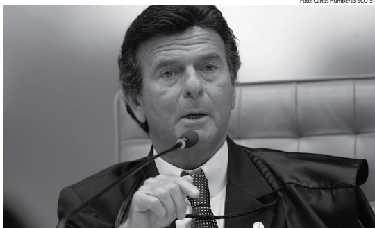
Ministro Luiz Fux marcou a audiência de conciliação para dia 3 de maio, quando pode ser definido o assunto

Em maio do ano passado, o ministro Luiz Fux concedeu uma liminar para sus-