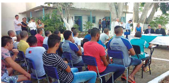
Todos são internos das unidades socioeducativas do Lar do Garoto e Abrigo Provisório do município de Lagoa Seca