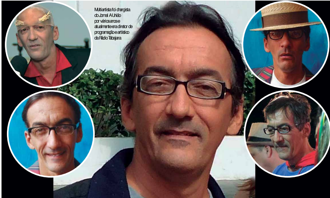
Militante foi dirigente do jornal A União por vários anos e atualmente era diretor de programação e artístico da Rádio Tabajara