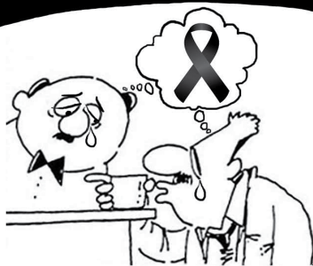
Sobre arte do Cristóvam Tadeu