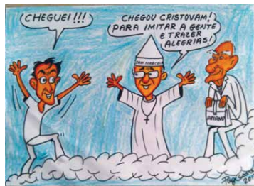
Humorista e dirigente do jornal A União foi o fundador do humorismo moderno da Paraíba. Imagem publicada nas páginas do jornal A União