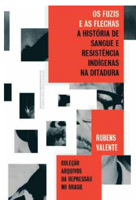
Obra de Valente denuncia violência contra os índios

"Em 1991, 1992, eu estive em uma área de uma etnia que se chamava Ofaié-Xavante. E lá eles me contaram que tinham sido transferidos pelos militares em um caminhão e haviam sido despejados lá no Pantanal, a 600 quilômetros dali [de seu território original]. Lembro que essa história me marcou muito, porque mostrou que havia uma coisa a ser contada nessa relação de índios com a ditadura, como eles sofreram impactos nesse período", contou o jornalista. Em viagens a outras