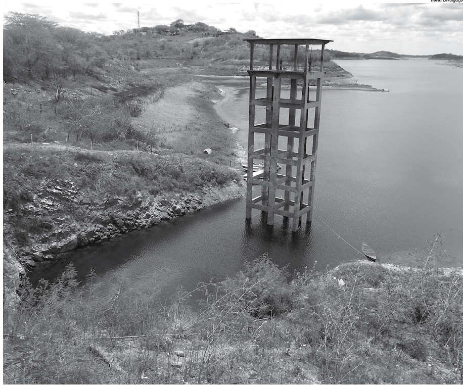
As águas da Transposição que entraram na Paraíba pela cidade de Monteiro estão percorrendo 130 km pelo leito do Rio Paraíba e chegarão à barragem de Boqueirão nos próximos dias

Os demais municípios são: Barra de Santana, Caturité, Queimadas, Pocinhos, Lagoa Seca, Matinhas, São Sebastião de Lagoa de Roça, Alagoa Nova, Boqueirão, Boa Vista, Soledade, Juazeirinho, Cubati, Pedra Lavrada, Olivados, Seridó, Cabaceiras.