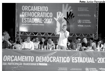
Orçamento Democrático 2017 foi lançado no final de semana em Cajazeiras

O governador Ricardo Coutinho abriu a plenária ressaltando a importância do Orçamento Democrático na Paraíba e destacando que é o único Estado do país que adota esse tipo de comportamento para se construir o orçamento estadual. "A Paraíba passou a ter um pro-